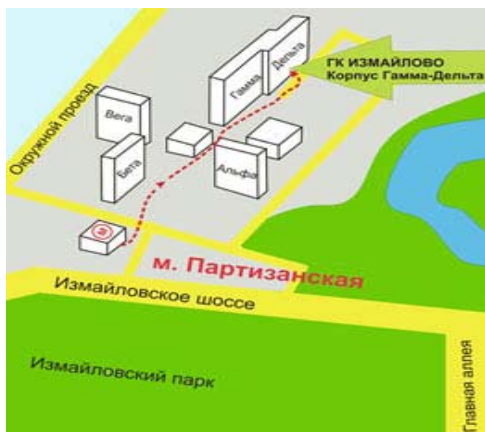
СХЕМА ПРОЕЗДА К МЕСТУ ПРОВЕДЕНИЯ КОНФЕРЕНЦИИ:

Конференция «НЕФТЕГАЗ-ИНТЕХЭКО-2008» проводится в конференц-залах "МОСКВА", расположенных на 3-м этаже центрального холла корпуса "Гамма-Дельта" ГК "ИЗМАЙЛОВО".